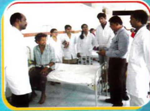
Students & Staff participating in ward rounds everyday along with eminent doctors