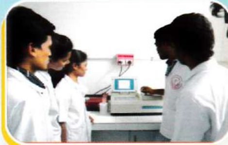
Drug analysis using UV spectroscopy