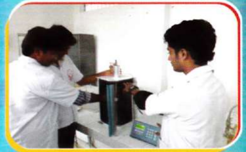
Students preparing Nanoparticle