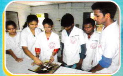
Dissecting Procedure in Frog