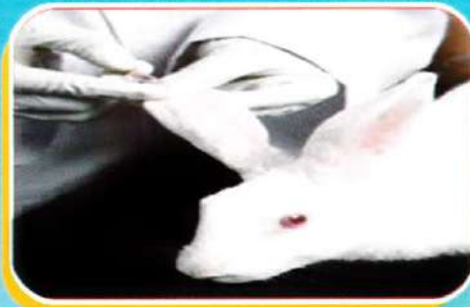
Blood withdrawal Technique