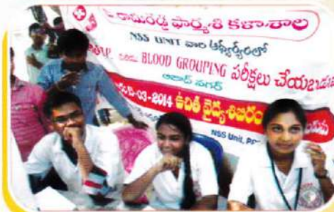
Students at NSS Camp