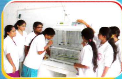
Students performing dissolution studies of Tablet