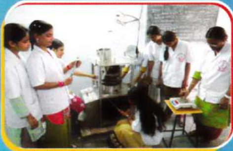
Tablet Punching Machine Students Manufacturing Tablets