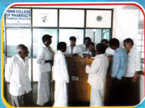
Drug Information Centre at RIMS. (Patients approaching Pharm-D students.)

Pharm D, a six-year integrated postgraduate programme is expected to take pharmacy education to international levels. Pharm D, is expected to provide plenty of opportunities to Indian students to practice pharmacy in abroad. They can pursue careers in various fields, including institutional practice, community pharmacy practice, managing patient care, drug information and long-term care, clinical liaisons with pharmaceutical industry, patient education and clinical trial research. Pharm D (Post baccalaureate), a three-year postgraduate programme is fit for B.Pharmacy students to practice in hospitals.