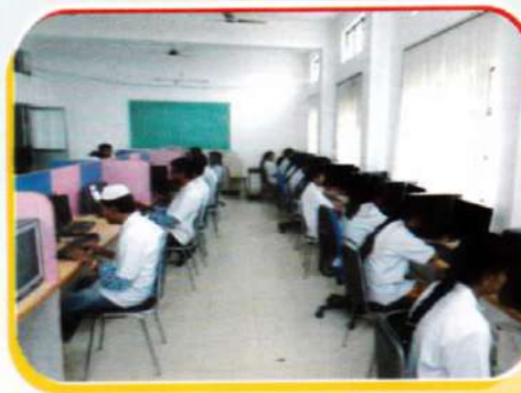
Hi-tech computer lab 100 computers connected in LAN with internet speed of 12 mbps.