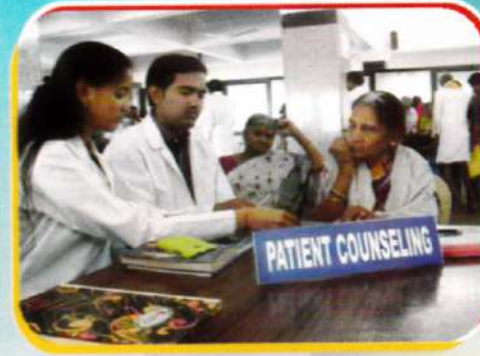
Pharm-D Students doing Patient Counselling and advising the patients regarding drug use.