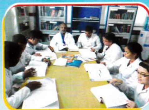
Collected case study is Discussing in DIC with staff