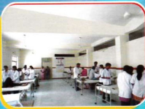
Ward round participation & Collection of patient details (Case Study)