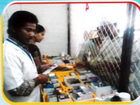
Pharm-D students participating in Drug dispensing