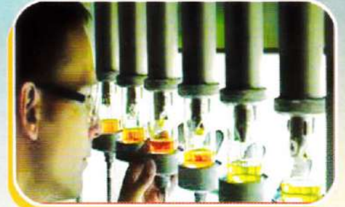
Plant extraction by Modern Soxhlet apparatus