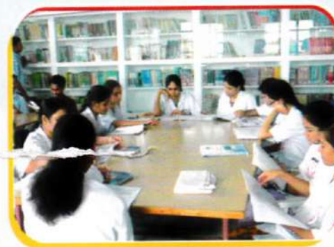
Digital Library with 10,000 volumes of books, journals and magazines.