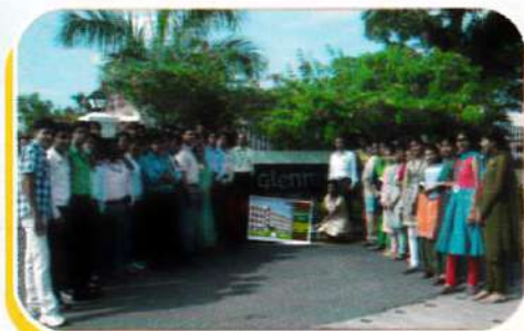
Final year Students visiting Industry