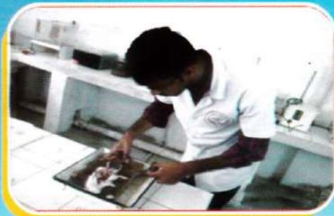
Student involved in Animal Dissection