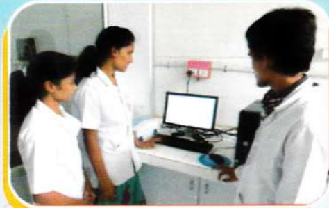
Drug characterization using FTIR