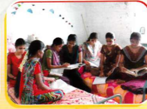
LADIES HOSTEL Home away from home spacious & delicious home made food, solar fencing, 24 hours water facility 325 KVA Generator available.